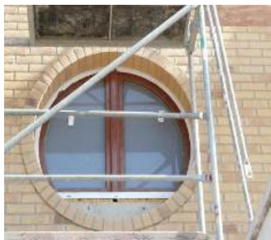
System ArtBrick dzięki idealnemu dopasowaniu koloru elewacji do systemów narożnych umożliwia tworzenie oryginalnych architektoniczne budowli

Niekwestionowaną przewagą systemu elewacyjnego ArtBrick nad tradycyjną cegłą jest brak dodatkowych fundamentów podtrzymujących elewację oraz elementów zbrojenia nadproży. Stanowi to oszczędność rzędu kilku tysięcy złotych oraz znacznie upraszcza sam proces montażu dzięki czemu elewację można układać na całej wysokości ściany, a nie jak dotychczas tylko od dołu. Ponadto cieńsza o 28% ściana zewnętrzna pozwala na uzyskanie kilku dodatkowych metrów kwadratowych powierzchni mieszkalnej, przy zachowaniu takiego samego obrysu budynku. Mimo iż tynk pozostaje tańszą alternatywą dla cegły klinkierowej, elewacja wykonana w systemie ArtBrick jest o 16% cieplejsza, przy zastosowaniu tej samej grubości ocieplenia. Z uwagi na trwałość materiałów i odporność na zanieczyszczenia powietrza, nie wymaga ona też gruntownego odświeżania i w efekcie kosztuje niewiele więcej od elewacji wykonanej z tynku.